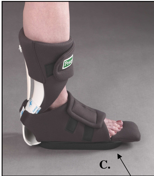
# 6148 Posey hielbeschermer deluxe met teenstuk én loopfunctie (afneembare zool)

Contra-indicatie: Niet gebruiken als het protocol van uw instelling dit niet toestaat.