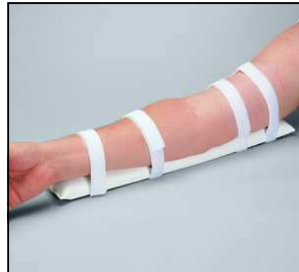
#8165 Herbruikbare (infuus-) armpalk voor volwassenen (10 x 48 cm)

Na gebruik afnemen met desinfecterende reiniger. Niet in de wasmachine.